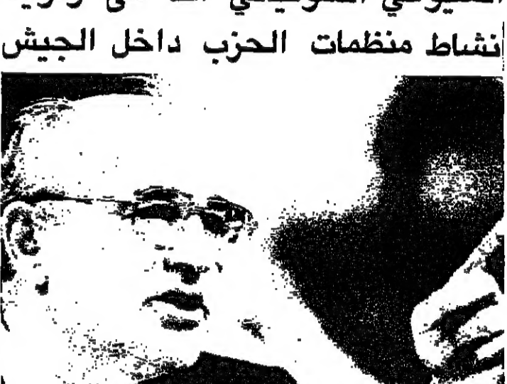
الرئيس السوفياتي ميخائيل غورباتشوف أثناء مناقشة مع الشيوعيين في المؤتمر

حصراً بتصرف وزير الدفاع ليل توريهها على وزارات عدة تابعة للاقتصاد والجمهورية. ووصف القرار الذي اقره المؤتمر امس باعتباره من الضروري تسريع وضع التصاريح المتعلقة بالدفاع وتحول الصناعات العسكرية. واكد القرار في الختام، ان المؤتمر يرفض زرع الصفة السياسية من القوات المسلحة، واطل على ما يمكن اعتباره طريقة لاختلال التعددية في صفوف الجيش انه يجب ان توضع اوليات عمل الأنشطة لمنظمات الحزب الشيوعي السوفياتي في صفوف الجيش لاقامة تنسيق بينه وبين الأنشطة الاقتصادية الاخرى العاملة في اطار القوانين السوفياتية. على صعيد اخر واجه الرئيس السوفياتي ميخائيل غورباتشوف مقاومة لسياسته الإصلاحية من جانب قطاعات مهمة من العمل السوفياتي امس، مع دخول مؤتمر الحزب اسبوعه الثاني والاخير. والم يظهر عمل منجم الفحم الذين يطالبون باستقالة الحكومة اي علامات على الاكترت بدعوتها الى الفاض اضراب العمل لمدة يوم واحد، ويعتزمون القيام به يوم الاربعاء وهو اليوم السابق للموعود المقرر لاختتام أعمال المؤتمر. واشارت تقارير صحافية عن اجتماع غورباتشوف مع مندوبي العمال والفلاحين في مطلع الاسبوع، ان وجود مخاوف من المزارع والمصانع من اصلاحاته المقترحة خاصة التحول الى اقتصاد السوق. ويتم عمل المناجم الحكومية ببطء عن اوفياء بوعود تحسين مستويات معيشتهم، وهي الوعود التي ائتت اضرابات بالمناجم منذ عام ١٩٨٥. واشنطن - ا ف ب